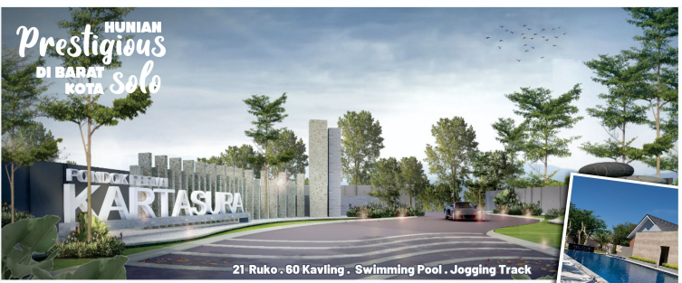
21 Ruko - 60 Kavling - Swimming Pool - Jogging Track

Gambar, ilustrasi & spesifikasi yang tercantum pada brosur ini berdasarkan situasi & kondisi pada saat perencanaan. Perubahan dapat terjadi sewaktu-waktu & merupakan hak penuh developer. Semua gambar di brosur ini berfungsi sebagai ilustrasi & bukan merupakan bagian dari kontrak jual beli.