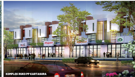
KOMPLEK RUKO PP KARTASURA